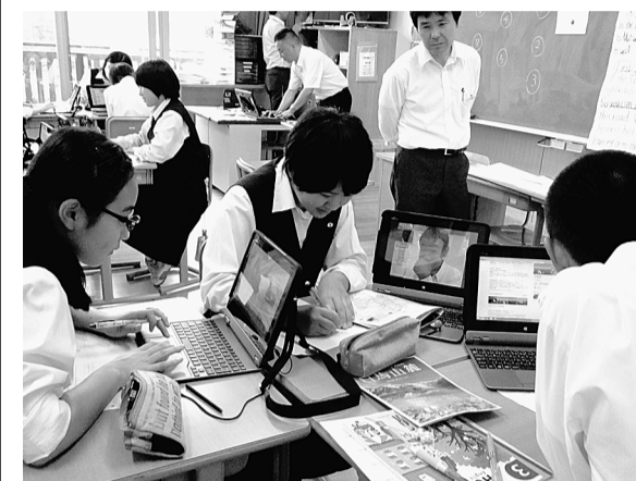
タブレットを協力的な学び合いで活用(白馬村立白馬中学校・長野県)

学校3校には普通教室用、特別教室用6台を整備。今年度は普通教室用12台を普通教室・特別教室に整備。今年度は普通教室用12台を普通教室・特別教室に整備。