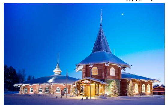
ロヴァニエミ(サンタクロース村) ※イメージ

憧れのサンタクロースに会える！ラップランド州の州都、ロヴァニエミ。商業の中心として栄え、日中は街中でショッピングなども楽しめます。1年中サンタクロースに会えるサンタクロース村へは市街から車で約15分、年間約50万人の旅行者が訪れる人気の観光スポットです。ロヴァニエミオーロラツアーは昼間の楽しみもいっぱい！レヴィでは北極圏ともなると冬の間、太陽の位置は極端に低く、たとえ晴れていてもごく短い間しか姿を現しません。夜間照明が常に点灯されている不思議な空気感を感じられます。