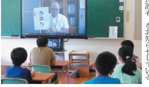
オンラインで全校集会などを実施