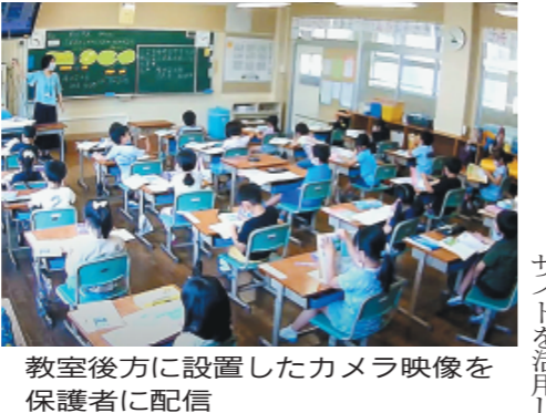
教室後方に設置したカメラ映像を保護者に配信