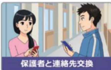
保護者と連絡先交換