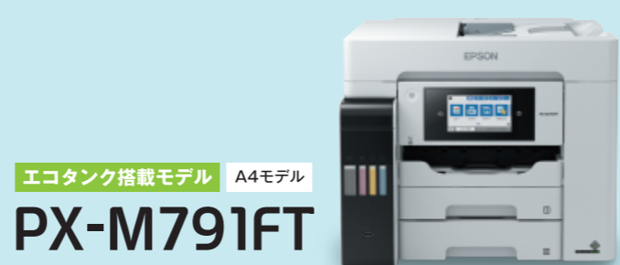
エコタンク搭載モデル A4モデル PX-M791FT