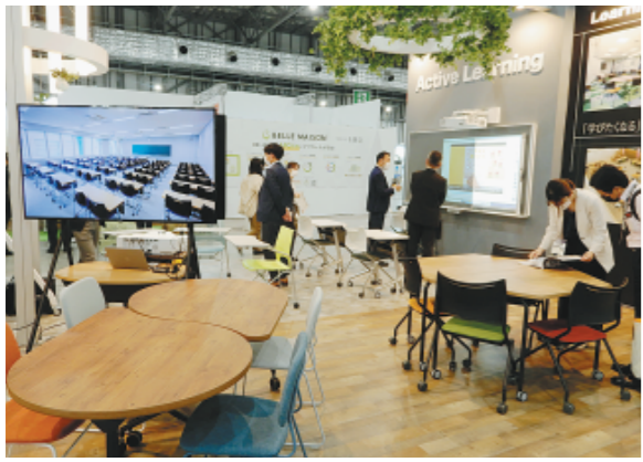
新しい学びを支援する様々な学習環境を提案 (昨年度EDIX東京より)