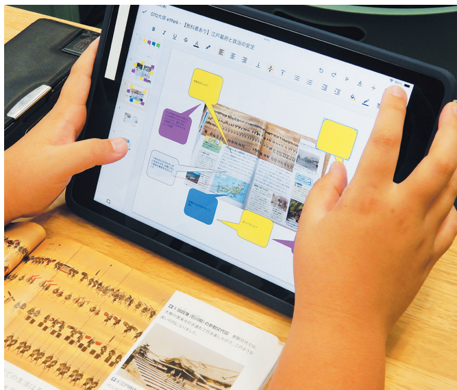
事実、疑問、発見などを色分けして書き込んでいる