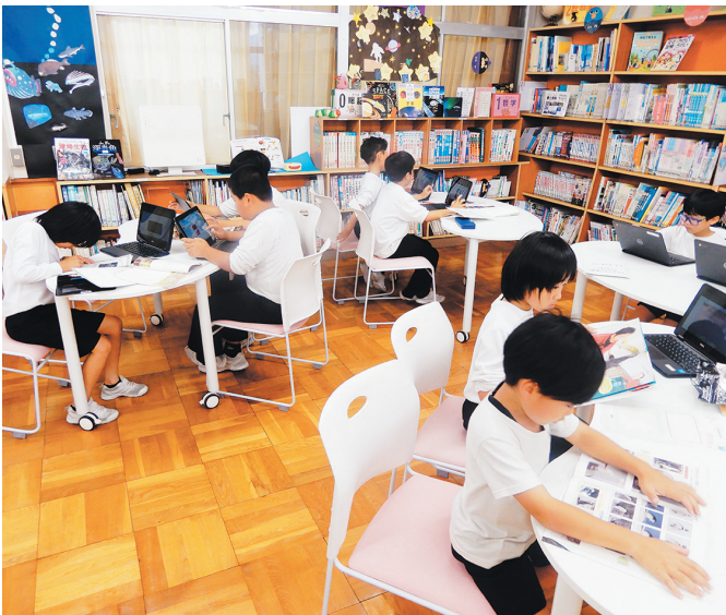
複線型授業では教室や図書室など自分の学びたい場所で学ぶ