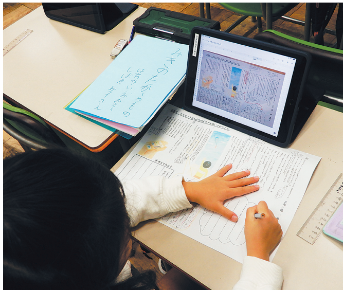
低学年では書く活動も重視している